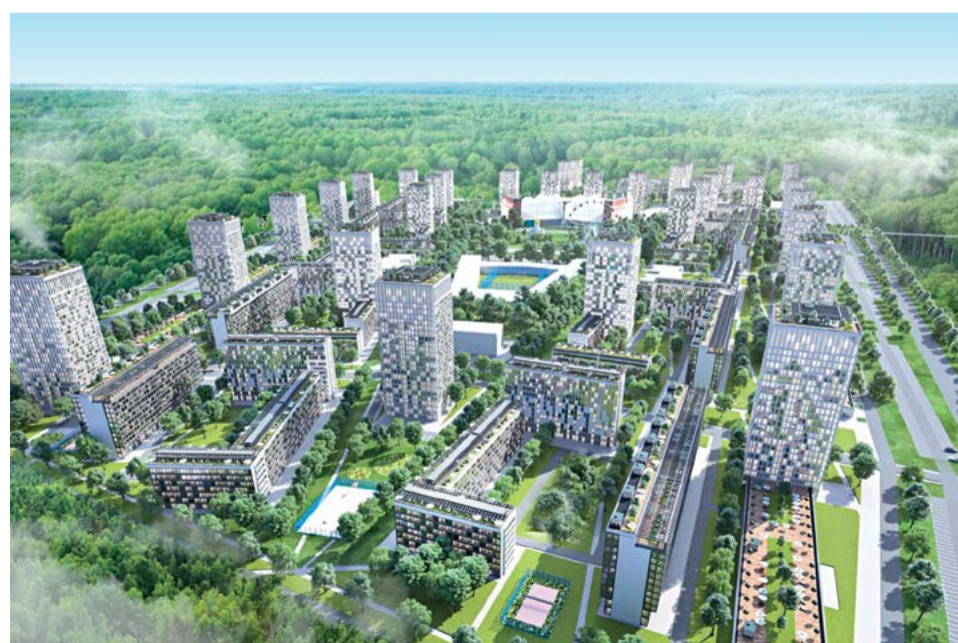
Предпроектное предложение по застройке микрорайона в Железнодорожном районе г. Воронежа

ДОО «Газпроектинжиниринг» представило на форум проект нового жилого комплекса на 30 тыс. жителей общей площадью около 100 га. Предполагается, что в ближайшее время проект может найти своё воплощение в союзе с одной из крупнейших строительных компаний Черноземья в микрорайоне «Отрожка».