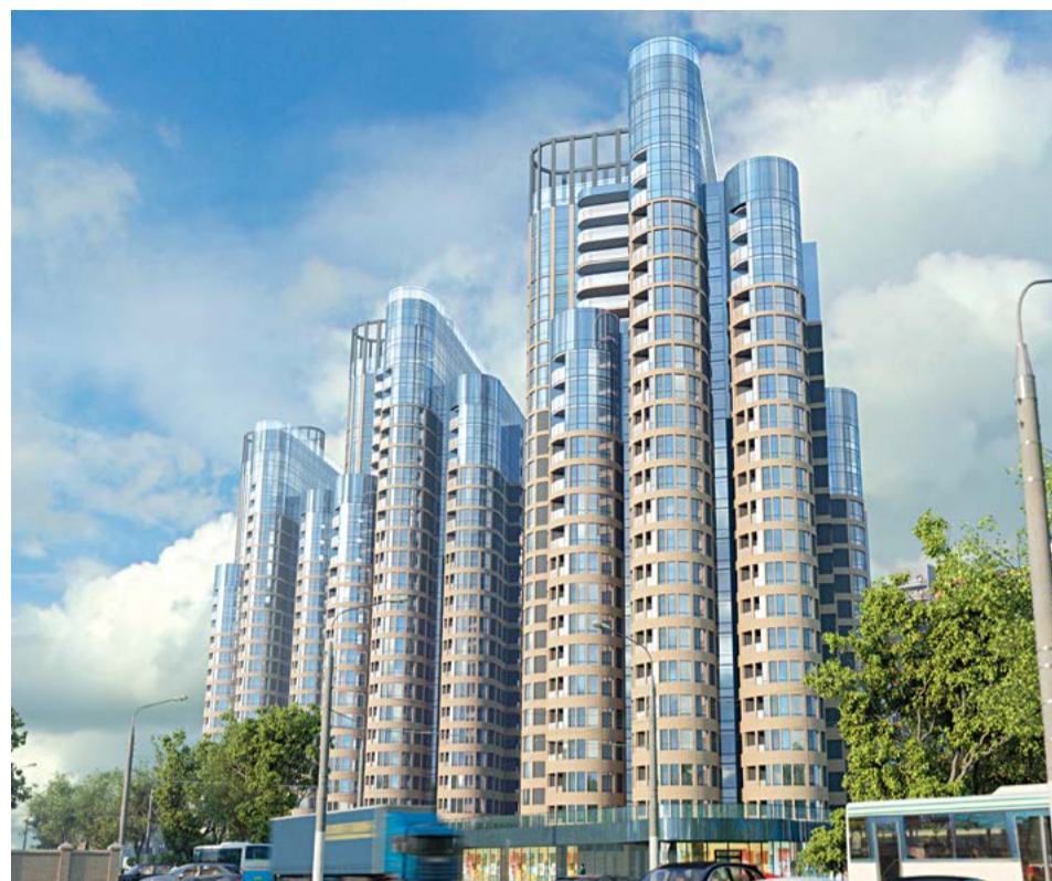
Ракурс с пересечения улиц Донбасская и 9 Января