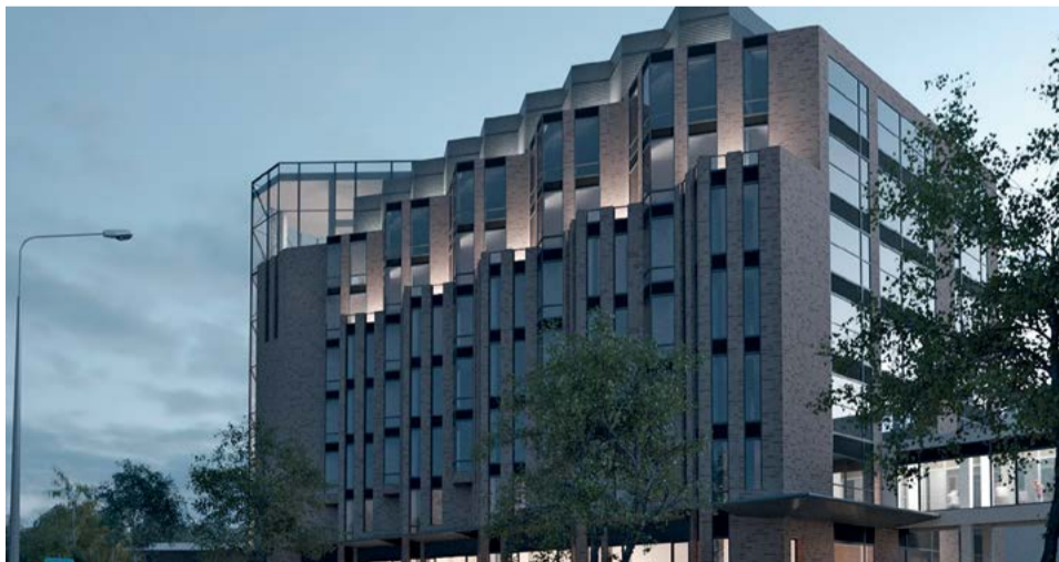
Реконструкция и расширение офисного административного здания г. Южно-Сахалинск, ул. Дзержинского, 35

Таким образом, данный договор позволит Обществу постепенно заменить ПНС в качестве стратегического партнера СЭИК, предоставляющего услуги по инженерно-техническому сопровождению проектов модификации производства, включая морские и наземные производственные объекты, а также завод СПГ.