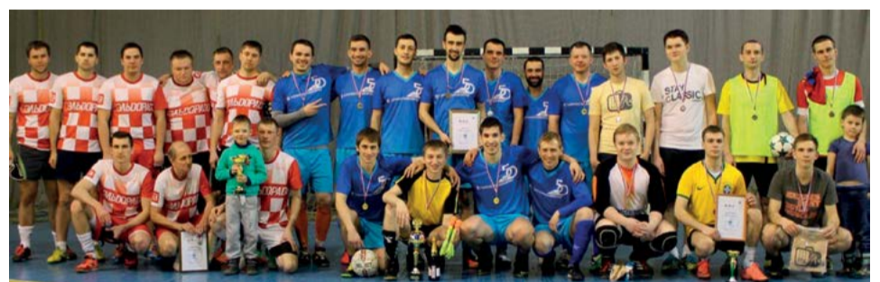
Призеры суперкубка по футболу 2017

В чем же причина феномена команды «Газпроектинжиниринг», постоянно занимающей призовые места в футбольных (и не только футбольных, кстати) корпоративных турнирах – среди 16, 18,