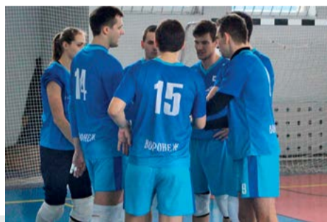
Минута на совещание