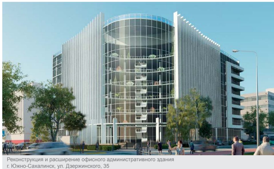
Реконструкция и расширение офисного административного здания г. Южно-Сахалинск, ул. Дзержинского, 35

В 2014 году ДОО «Газпроектинжиниринг» выиграло конкурс на право заключения договора с «Сахалин Энерджи Инвестмент Компани» (СЭИК) на разработку инженерного проекта дооборудования крановых узлов средствами аварийного опорожнения газового трубопровода диаметром 48 дюймов. Нефтегазовая компания «Сахалин Энерджи» ведет освоение Пильтун-Астохского и Лунского месторождений на северо-восточном шельфе острова Сахалин.