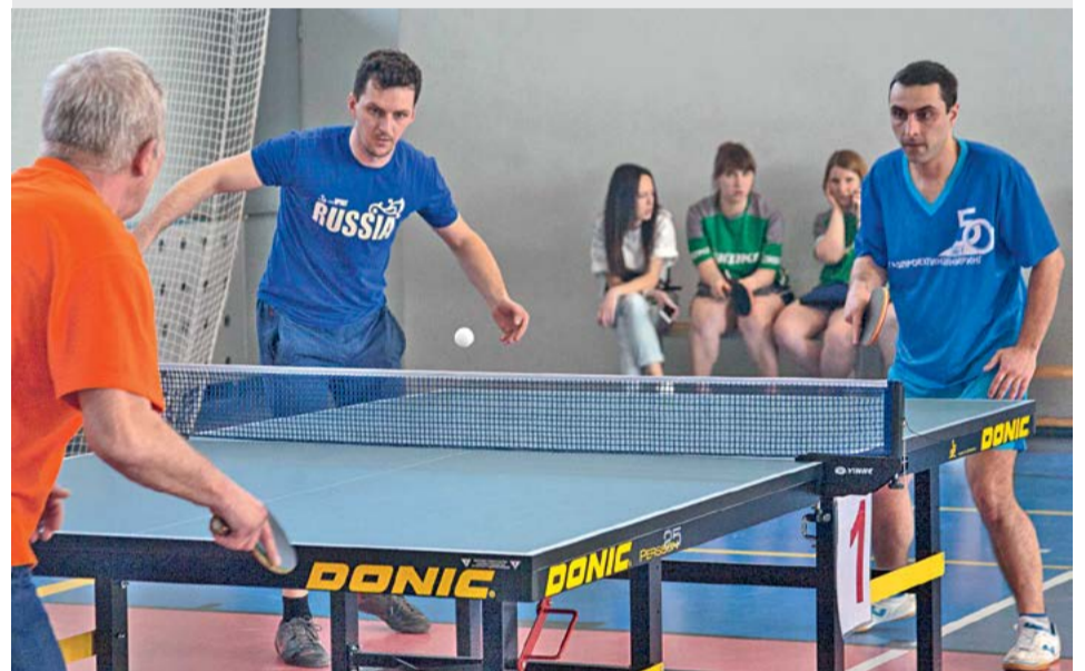
Магия теннисного шарика