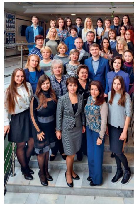
11-й технологический отдел ДАО Газпроектинжиниринг

- Во время учёбы в политехническом институте я занималась художественной гимнастикой. После устройства на работу быстро влилась в общественную жизнь коллектива. У нас всегда проводились концерты ко Дню строителя, Новому году, и мои выступления