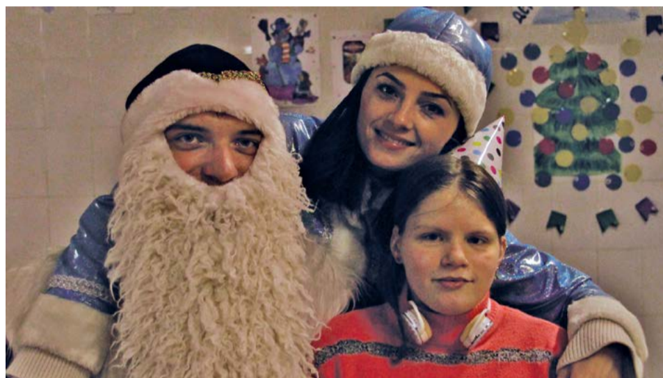
Радости детей не было предела.