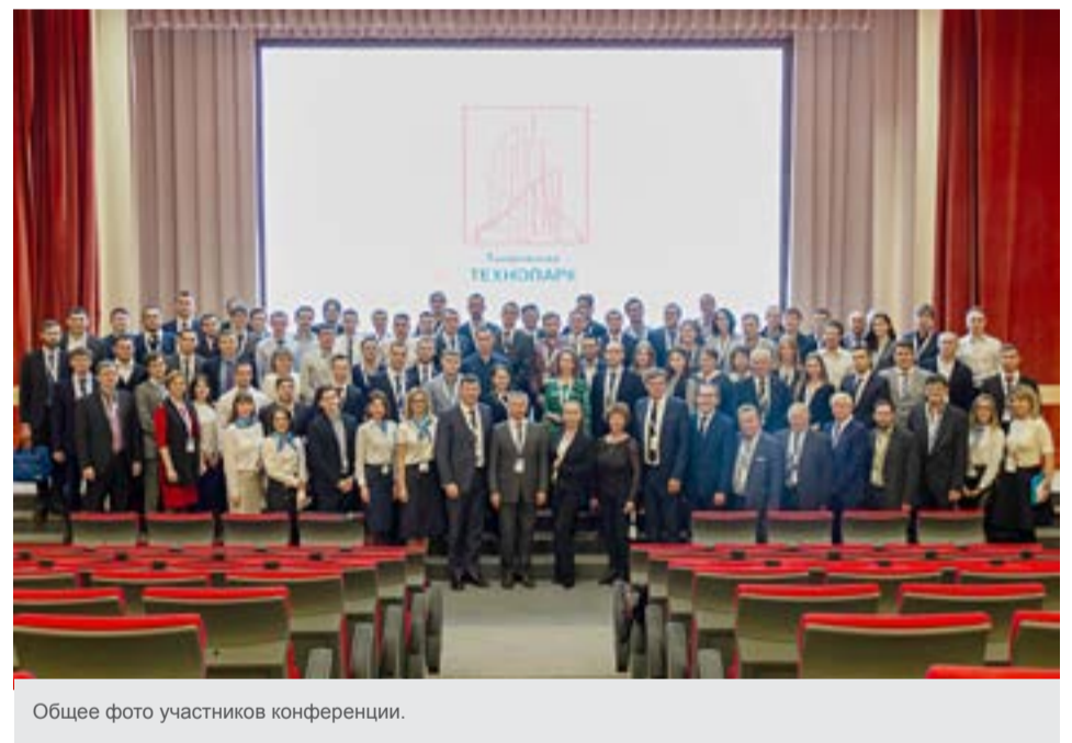
Общее фото участников конференции.