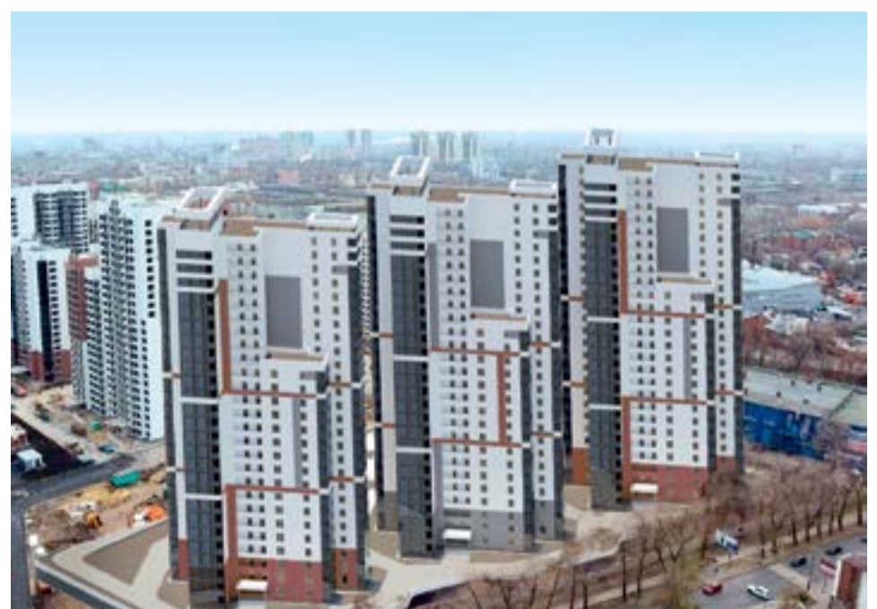
Новый облик жилого комплекса по ул. 9 Января.